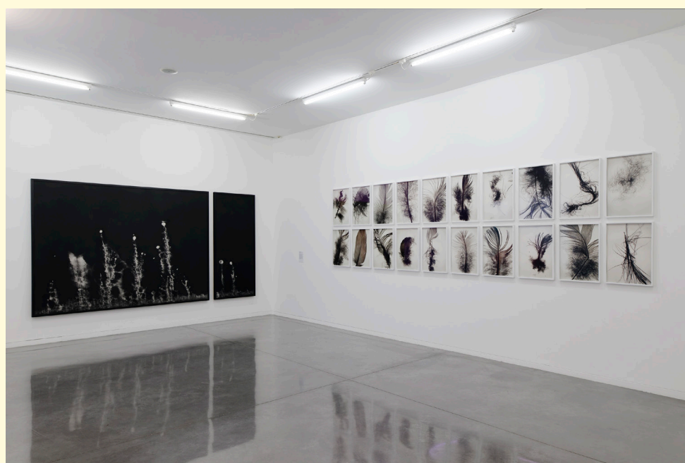
La Pergola , vue de l'exposition au Mrac Occitanie/ Pyrénées-Méditerranée, Sérignan, 2017.

L'accrochage des collections présente dans un même espace la collection historique, les acquisitions 2016 et le dépôt du Cnap (Centre national des arts plastiques). L'exposition emprunte son titre à l'œuvre éponyme de Pierre Leguillon acquise par le musée en 2016.