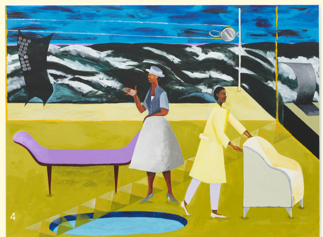
4. Le Rodeur: The Pulley , 2017. Acrylique sur toile, 183 x 244 cm. Courtesy de l'artiste et Hollybush Gardens, Londres. Photographie par Andy Keate.

Lubaina Himid La Complainte du progrès Io Burgard 07.04 > 16.09.2018 La Pergola > 10.06.2018